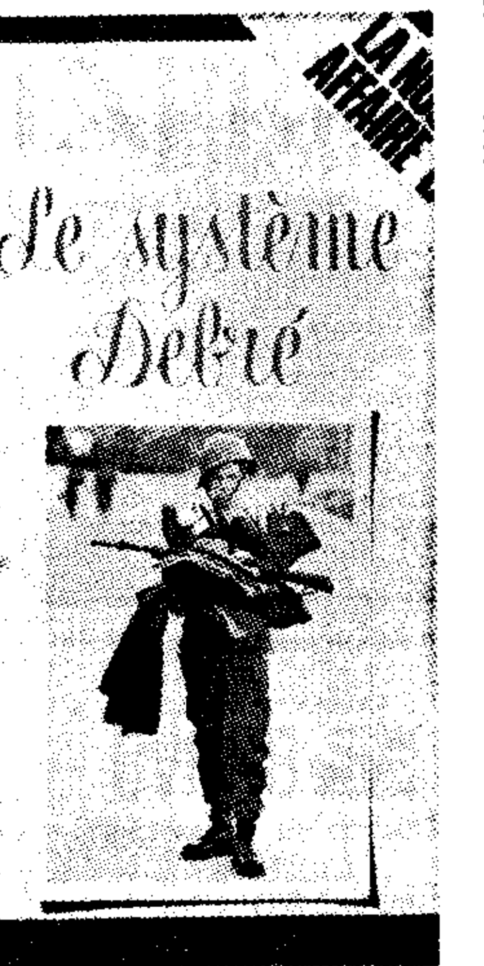
Το εξώφυλλο της έπιθεωρήσεως «Εξπρές», με την έρευνα για την αντοχή των Γάλλων σπουδαστών έναντι της στρατιωτικής θητείας

● Η ΓΑΛΛΙΑ όμως προχώρησε σε μία δημοκρατικοποίηση της εκπαιδευσης. Μία διαφορετική κατάσταση προέκυψε και οι αριθμοί μπορούν να την εξηγήσουν.