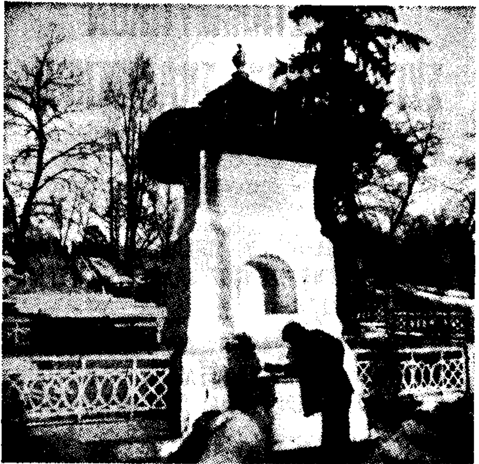
Η πηγή απ' όπου αναβλύζουν τα «δάκρυα του Μανόλε»